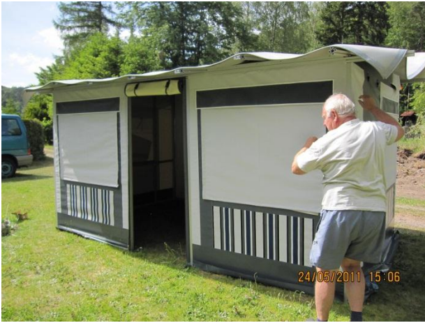
Das Dach muss noch gespannt und auf die Platte getragen werden.