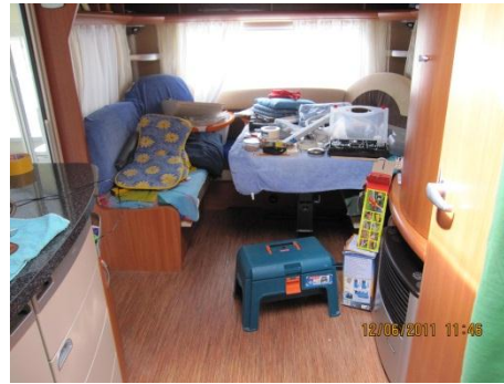
Zu diesem Zeitpunkt wurde alles in den WW gepackt, da ja noch kein Vorzelt stand.